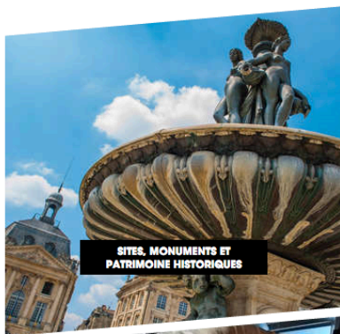
SITES, MONUMENTS ET PATRIMOINE HISTORIQUES