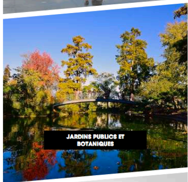
JARDINS PUBLICS ET BOTANIQUES