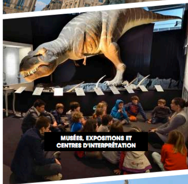
MUSÉES, EXPOSITIONS ET CENTRES D'INTERPRÉTATION