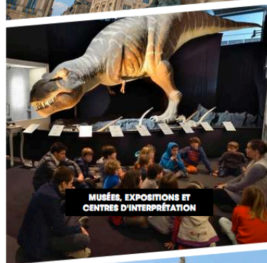
MUSÉES, EXPOSITIONS ET CENTRES D'INTERPRÉTATION