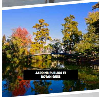
JARDINS PUBLICS ET BOTANIQUES