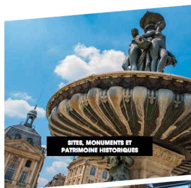
SITES, MONUMENTS ET PATRIMOINE HISTORIQUES